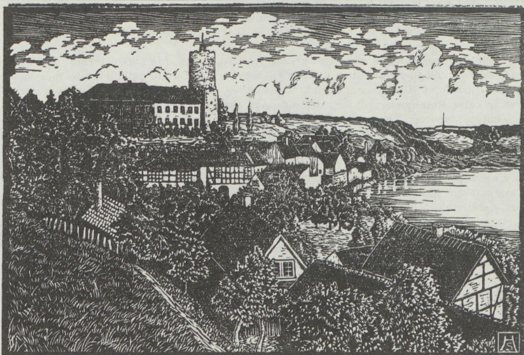
Maibild aus dem Oststernberger Heimatkalender 1931. Blick auf Burg und Stadt Lagow. Linienschnitt von Hanns Spudich.

Meine Damen, meine Herren, liebe Heimatfreunde!